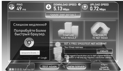
Рисунок 4. Скорость передачи данных по Speedtest.net при использовании «Connect»