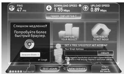
Рисунок 2. Скорость передачи данных по Speedtest.net без использования «Connect»

2.2. Измерьте скорость соединения, используя сервисы speedtest.net или pingtest.net (см. рис.2). Запомните или запишите измеренную скорость.